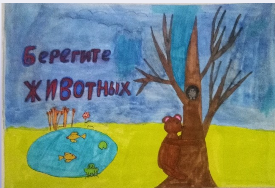
Иллюстрация: Гнутова Ксения, 6 «Г» класс